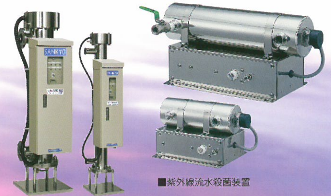
■紫外線流水殺菌装置